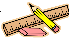
BLYANT VISKELÆDER LINEAL